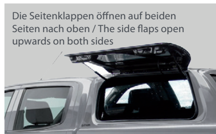
Die Seitenklappen öffnen auf beiden Seiten nach oben / The side flaps open upwards on both sides