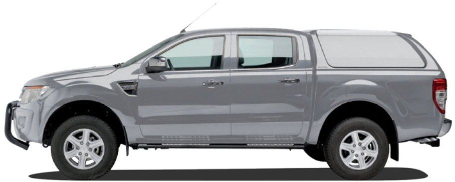
HARDTOP RH4 DC MIT GESCHLOSSENEN SEITEN

GLASHECKKLAPPE IM KUNSTSTOFF- RAHMEN ODER KOMPLETTE KUNST- STOFF-HECKKLAPPE PLASTIC FRAMED REAR DOOR WITH GLASS INSERT OR COMPLETE PLASTIC REAR DOOR