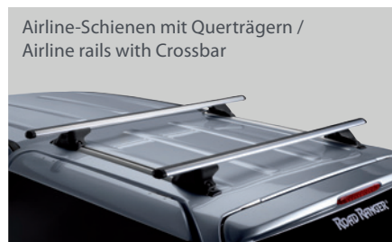
Airline-Schienen mit Querträgern / Airline rails with Crossbar