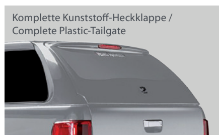
Komplette Kunststoff-Heckklappe / Complete Plastic-Tailgate