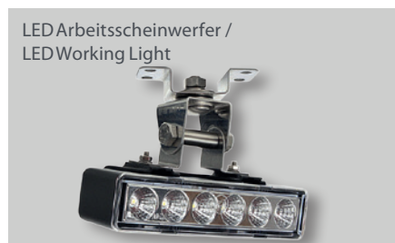
LED Arbeitsscheinwerfer / LED Working Light